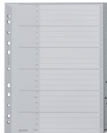
24-teilig, A4 überbreit