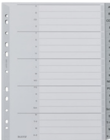
20-teilig, A4 überbreit