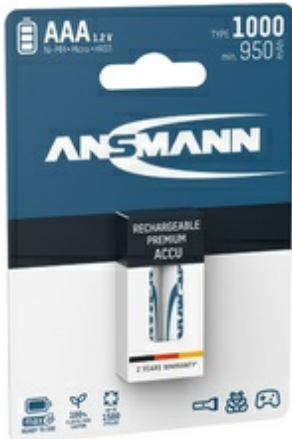
NiMH Micro (AAA) Akkus, 1000 mAh, 2 Stück

- Für den Einsatz in z.B. Digitalkameras, Blitzgeräte, MP3-Player