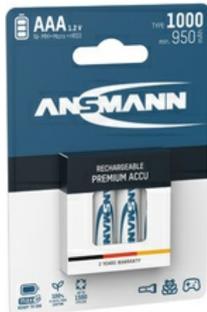
NiMH Micro (AAA) Akkus, 1000 mAh, 4 Stück