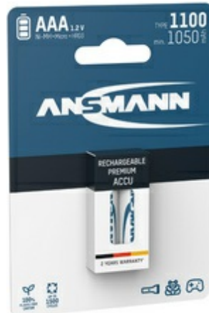
NiMH Micro (AAA) Akkus, 1100 mAh, 2 Stück