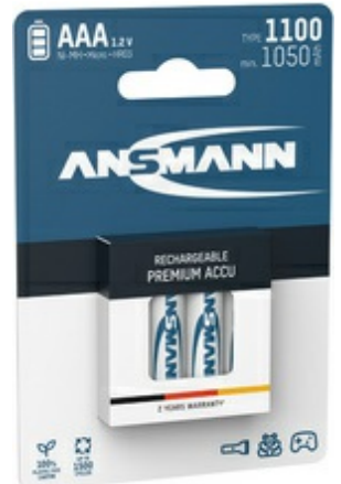
NiMH Micro (AAA) Akkus, 1100 mAh, 4 Stück