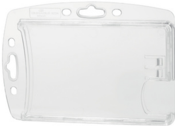
Namensschilder Doppelbox, Daumenstanzung