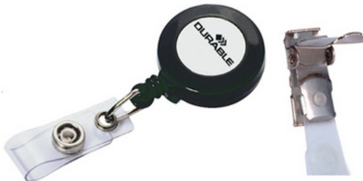
Zubehör: Ausweishalter - Ersatz-Clip