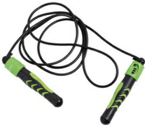
Springseil mit Zählerfunktion "Jump Rope"