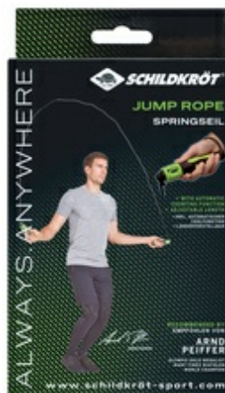
Springseil mit Zählerfunktion "Jump Rope", Verpackung