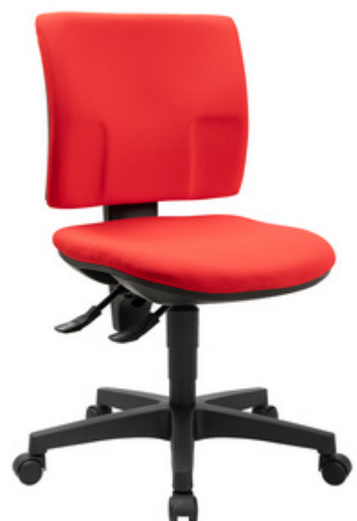
Bürodrehstuhl "PRO 30", rot