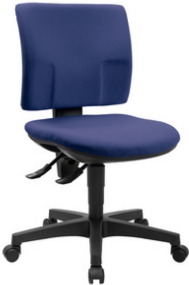
Bürodrehstuhl "PRO 30", blau