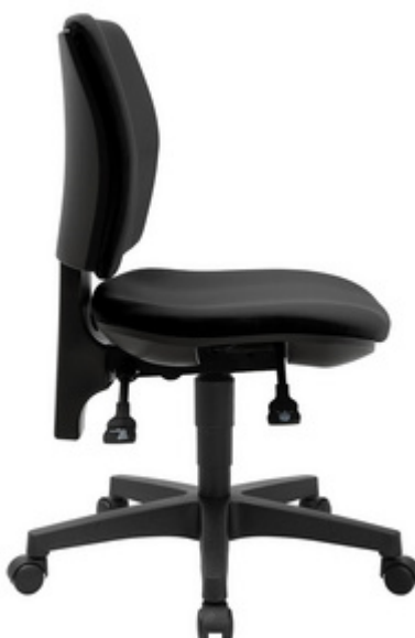
Bürodrehstuhl "PRO 30" - Seitenansicht