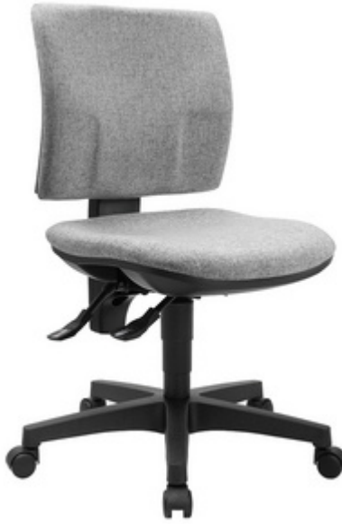
Bürodrehstuhl "PRO 30", hellgrau