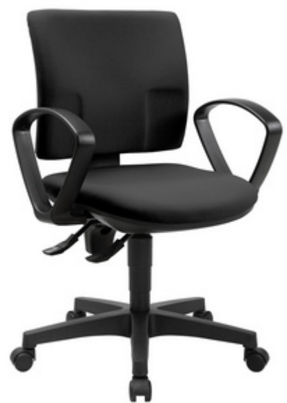
Bürodrehstuhl "PRO 30", inkl. optionale Armlehne B2(B)