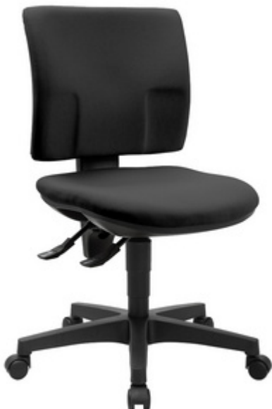
Bürodrehstuhl "PRO 30", schwarz