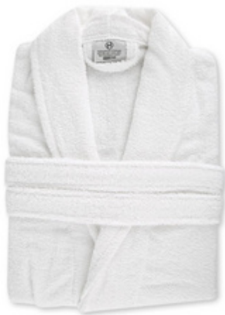
Bademantel mit Schalkragen