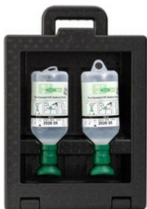
Augenspül-Station IBOX, 2 x 500 ml Augenspüllösung