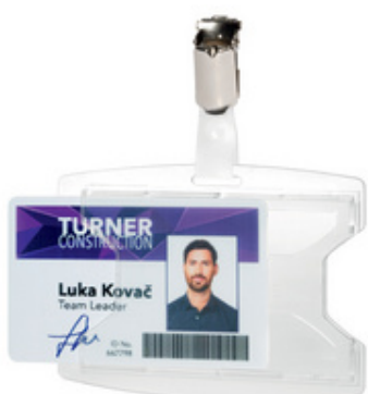
Ausweishalter reXycle mit Clip, für 1 Karte