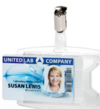
Ausweishalter reXycle mit Clip, für 2 Karten