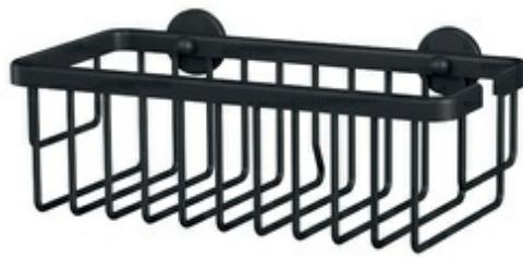
Duschkorb MOON BLACK