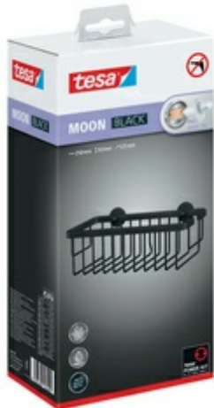
Duschkorb MOON BLACK, Verpackung

Weitere Artikel der Serie MOON BLACK finden Sie über die Stichwortsuche im WebShop!