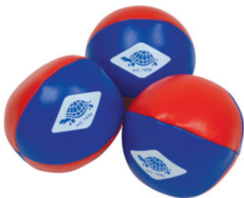
Jonglierbälle, 3er Set

- sowohl für Anfänger als auch für Fortgeschrittene