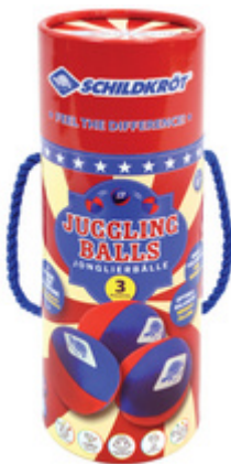
Jonglierbälle, 3er Pack, Verpackung