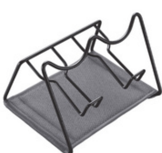
Abtropfgestell Sodatex 2 LAVA

- multikompatibel: geeignet für eine Vielzahl von Flaschen, darunter SodaStream, mySodapop, Aarke, Levivo und viele andere